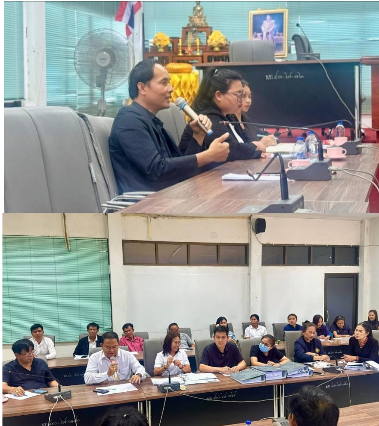
ผลการประเมินในภาพรวม